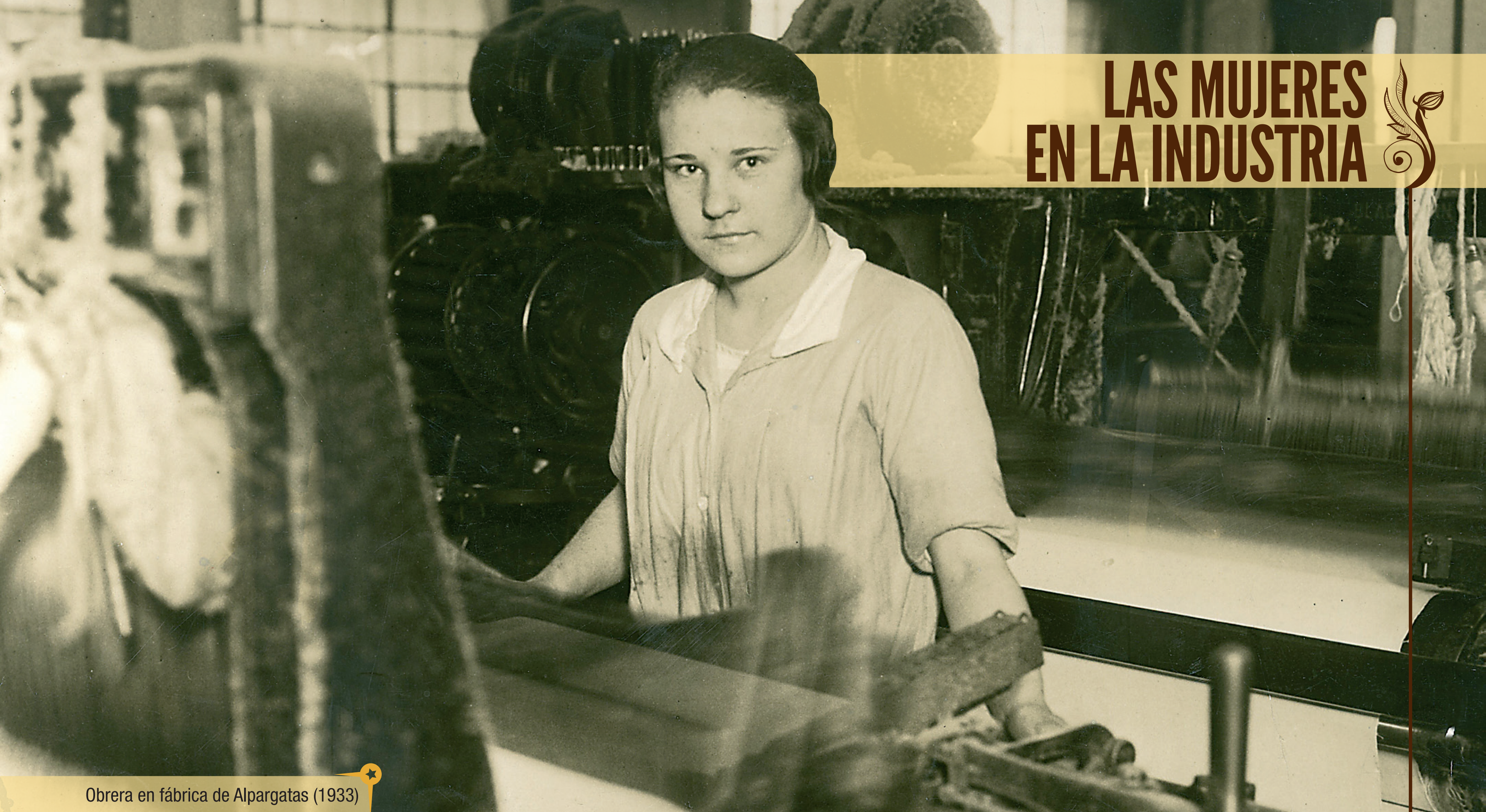
Obrera en fábrica de Alpargatas (1933)

El desarrollo de la gran industria puso el foco en el trabajo fuera del ámbito doméstico y permitió desentrañar las condiciones de explotación y opresión a través de las denuncias de las organizaciones gremiales y del Centro Socialista Femenino.