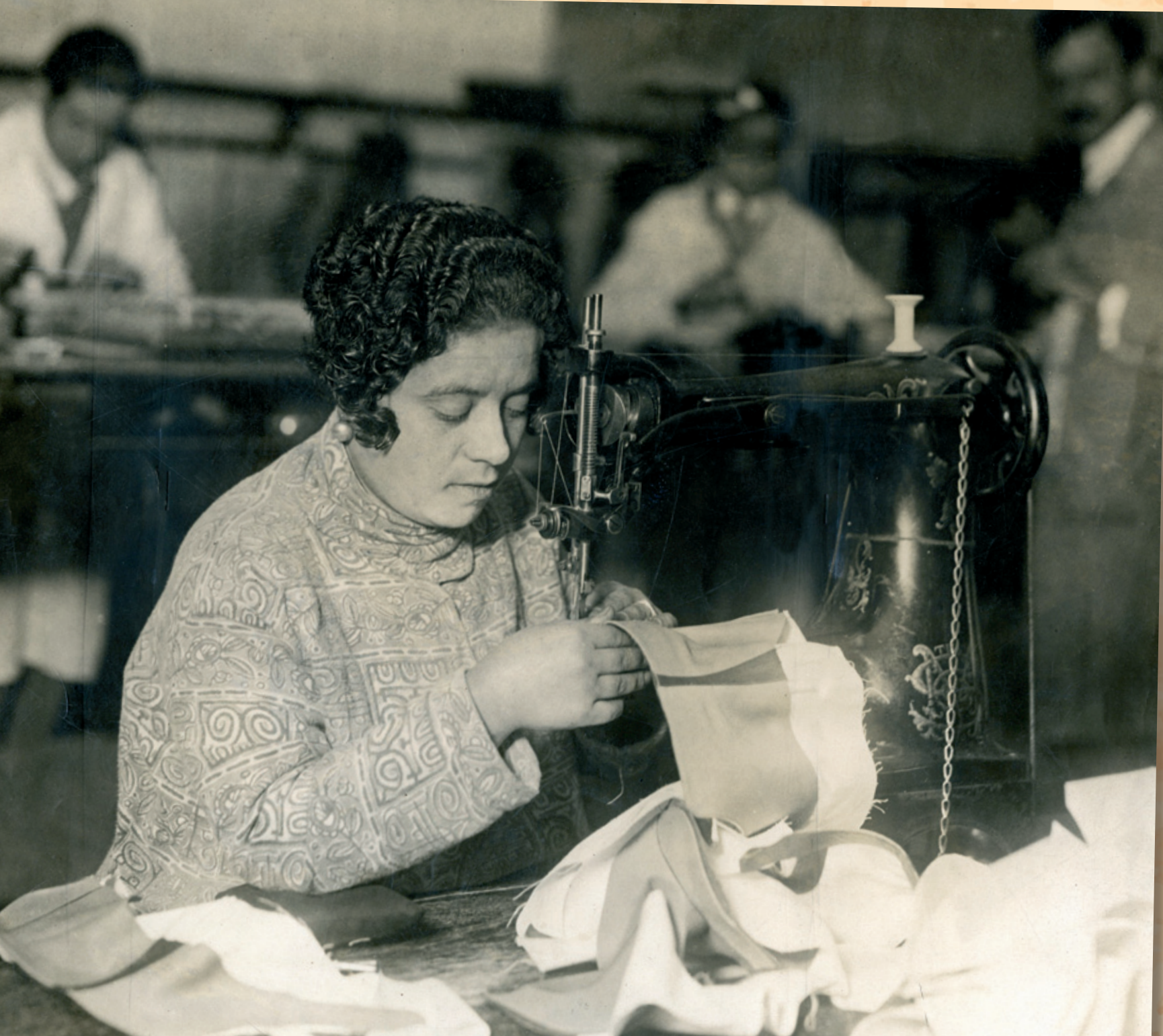
Obrera aparadora en fábrica de calzado