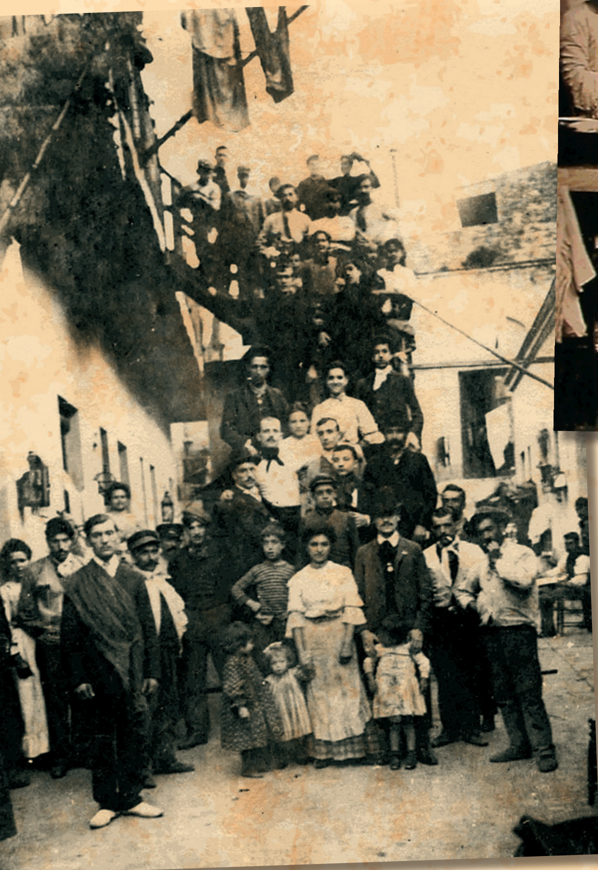
Desalojo durante la huelga (1907)