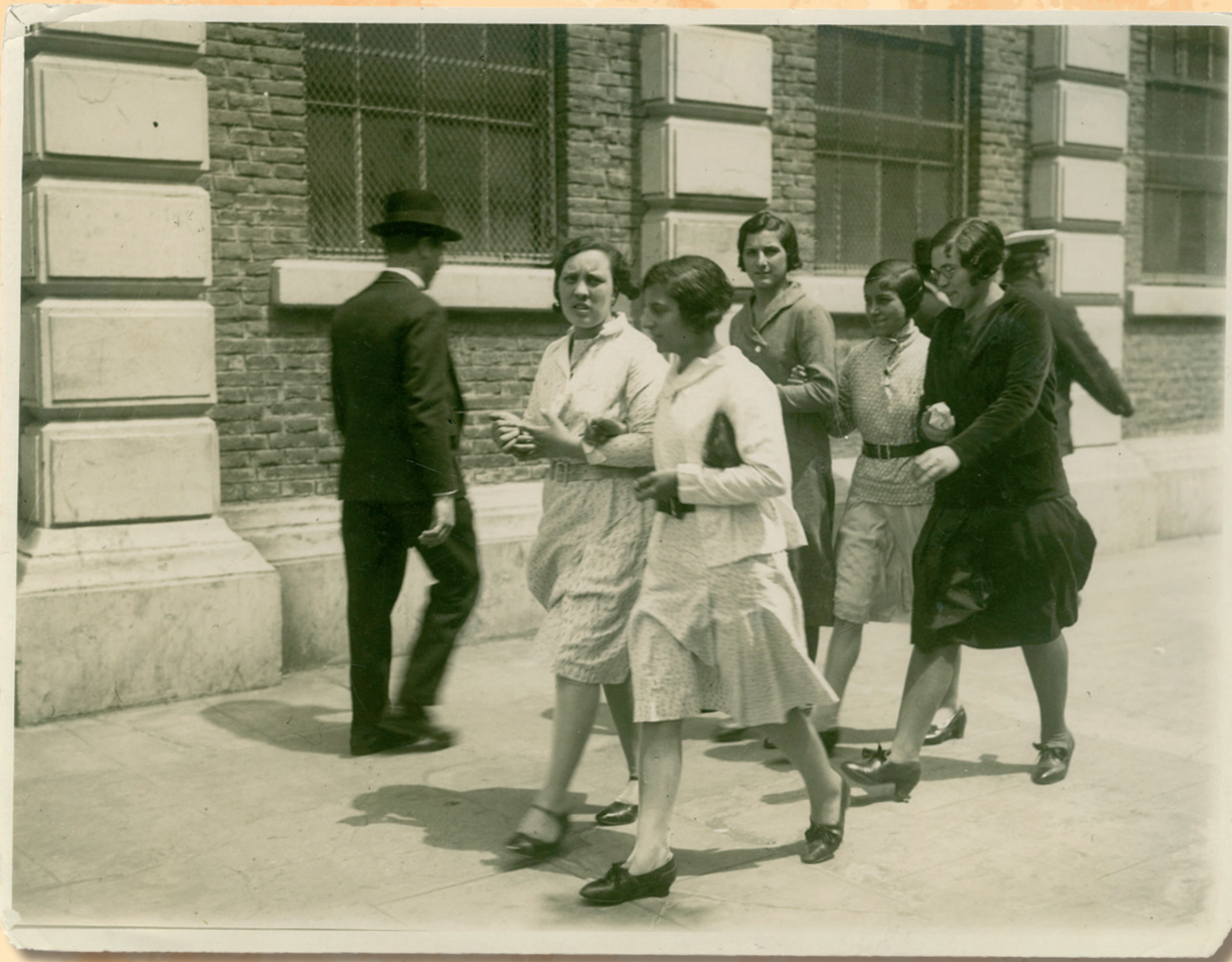
Obreras de la ciudad de Buenos Aires camino al trabajo (1928)

Planchadoras en un establecimiento comercial (1929)